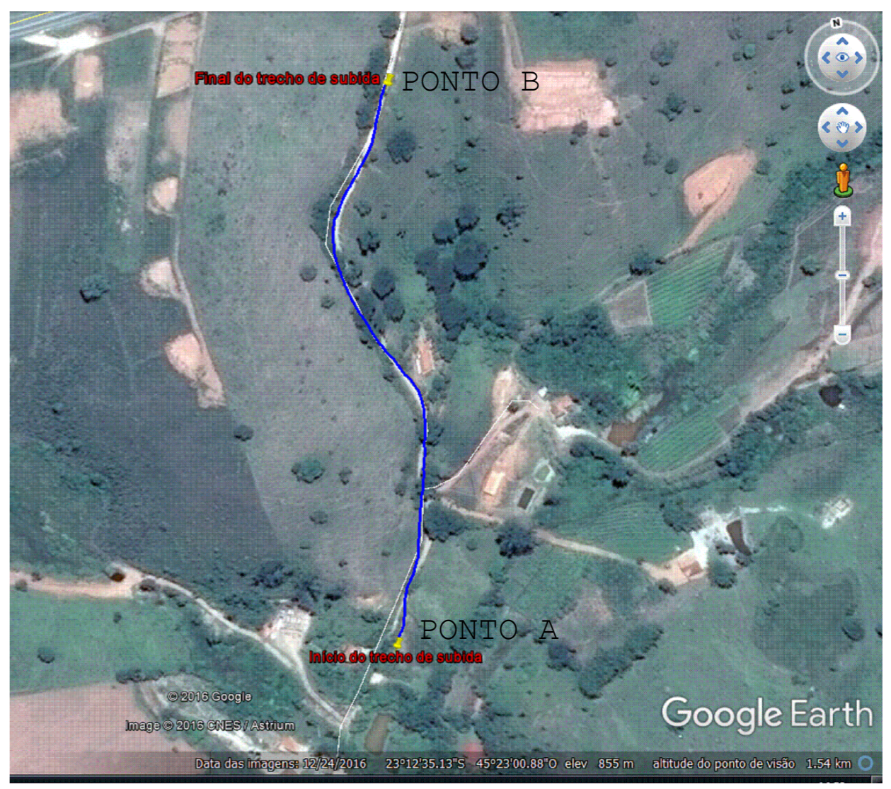
IMPLANTAÇÃO DO TRECHO DO MORRO DA CAMARINHA SEM ESC.